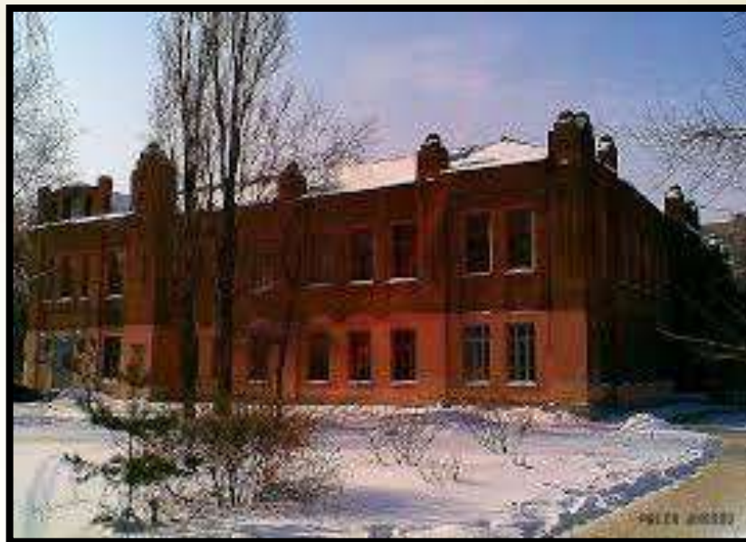
Псковская мужская гимназия