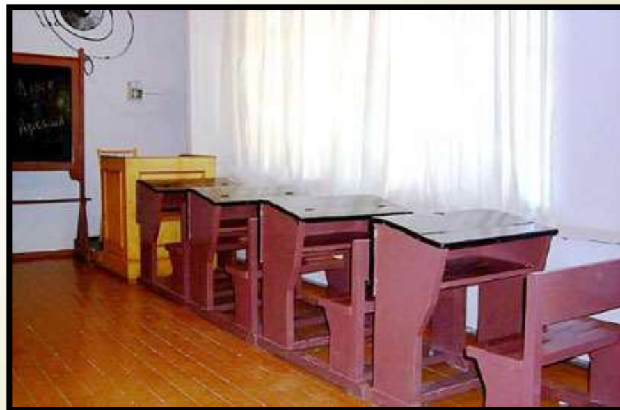
Гимназический класс (фрагмент экспозиции музея Л.А. Кассиля)